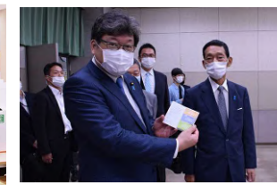
（左図：学生 食堂における 間仕切り）