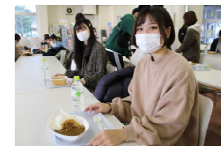
（学生応援ランチを 食べる学生）