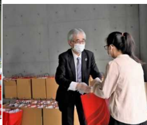
（食支援プロジェクト配布当日の様子）