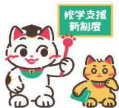
「高等教育の修学支援」公式キャラクター 【まねこ先生（左）とまなびーニャ（右）】

より多くの学生・生徒やその保護者の方々に、本制度のことを知っていただけるよう、 文部科学省と日本学生支援機構において次のコンテンツを用意しています。是非ともご覧いただくようご案内ください。